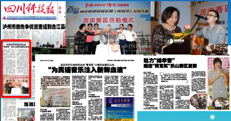
【四川科技報】首屆兩岸四地校園金曲音樂大賽西南賽區啟動